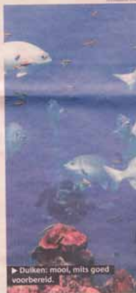
► Duiken: mooi, mits goed voorbereid.